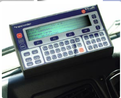
Assistente de Actividades Embarcado

A Tecmic desenvolve, desde 1988, soluções profissionais para gestão de frotas, gestão de equipamentos remotos e gestão de acessos, que permitem elevadas reduções de custos e a optimização dos recursos para um vasto leque de empresas. Acreditando na excelência das suas soluções, a Tecmic leva "literalmente" ao interior das empresas, em tempo real e de forma automática, a actividade económica dos colaboradores, equipamentos e viaturas desenvolvida no exterior.