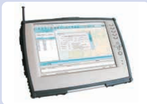
Equipamentos XTraN nos veículos