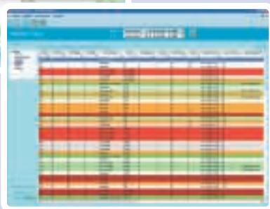
Monitorização da execução dos serviços