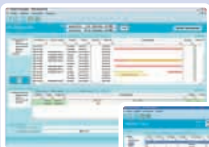
Planeamento dos serviços e atribuição às equipas