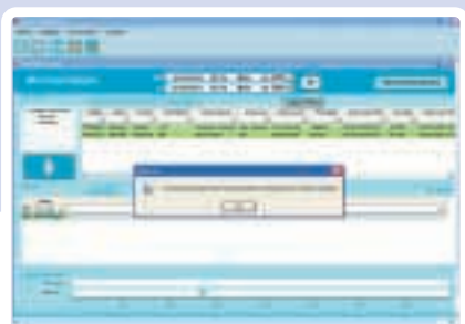
Recepção de anomalias dos serviços

Líder em soluções de gestão de frotas e pioneira em vários sistemas implementados, a Tecmic completa a sua oferta com esta aplicação, que permite otimizar o planeamento, em função dos recursos disponíveis e das suas competências.