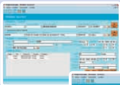
Introdução dos pedidos