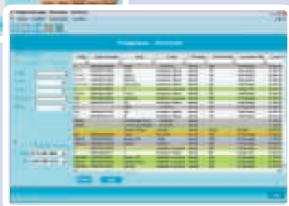
Planeamento dos serviços e atribuição às equipas