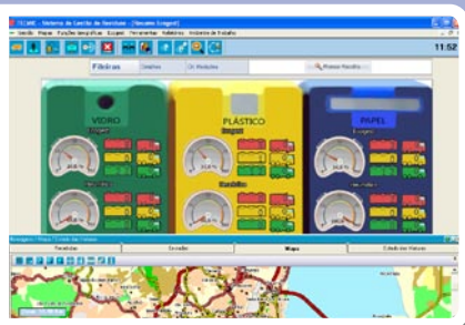
Controlo do nível de enchimento dos contentores