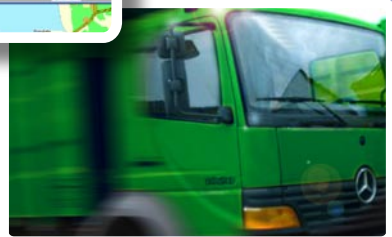
Optimização dos circuitos baseado nas necessidades de recolha reais

Com soluções que permitem elevadas reduções de custos e optimização dos recursos, a Tecmic permite o ganho de margens e o sucesso dos seus clientes, preparando-os para competir nos mercados mais difíceis. Tendo sido fundada em 1988 a Tecmic desenvolve e inova de forma contínua, sendo, hoje, líder nas soluções que oferece.