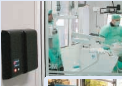
Painéis de Parede de pequena dimensão e design neutro

O acompanhamento após-venda de todos os sistemas instalados pela Tecmic é a base para a satisfação e fidelização do cliente. A nossa assistência para o hardware e o software apoia-se numa equipa experiente e pronta a responder com eficácia a todas as situações relacionadas com o desempenho dos nossos sistemas. Disponibilizamos um serviço de Assistência Telefónica Siga , de forma a esclarecer qualquer dúvida sobre o funcionamento dos equipamentos e software.