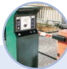
Painel de parede / Bastidor / Pilarete de chão / Pórtico