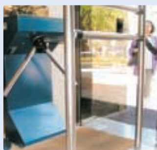
Torniquetes onde a segurança é um factor primordial