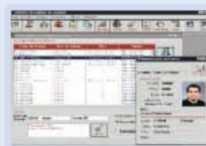
Gestão de Acessos