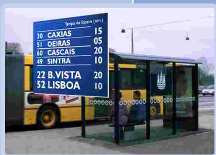
Informação aos passageiros